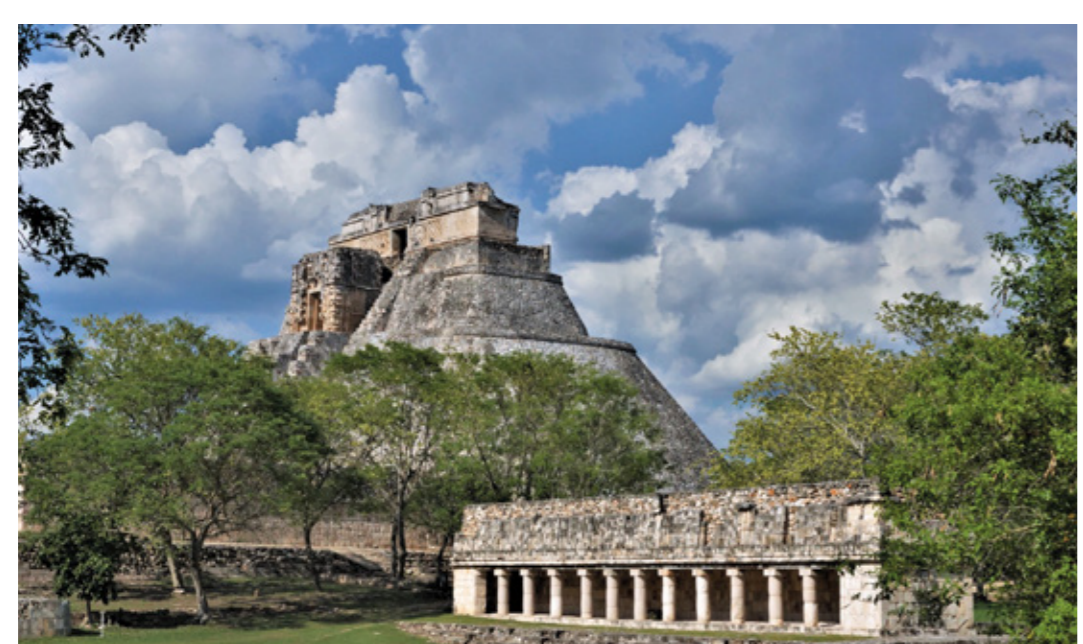
Acuario INAH, 85 AÑOS Guardián de nuestra memoria Septiembre 2024

GALERÍAS ACUARIO, GRUTAS Y GANDHI ABIERTAS LAS 24 HORAS, GALERÍA JUVENTUD HEROICA ABIERTA DE 6 A 18 HORAS