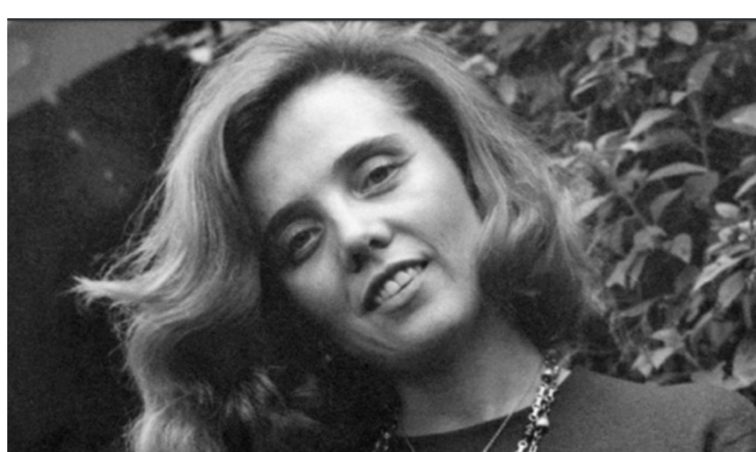
GRUTAS Homenaje fotográfico a Elena Poniatowska Septiembre 2024