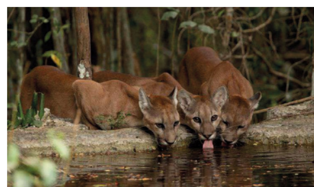
GANDHI Tesoros de Calakmul Septiembre 2024